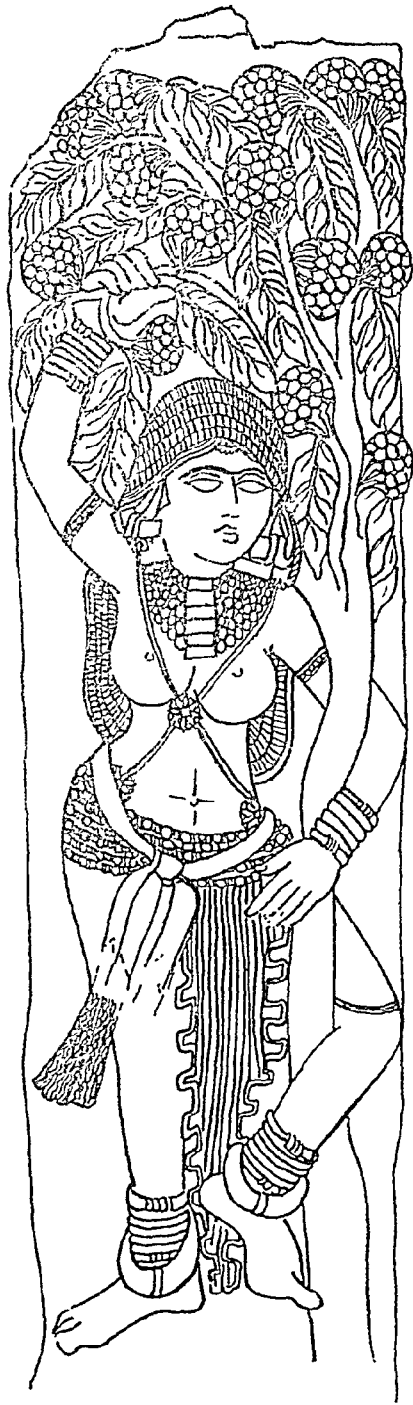
अशोक पुष्प प्रचय भरहुत से प्रात वेदिका-स्तम्भ के आधार पर